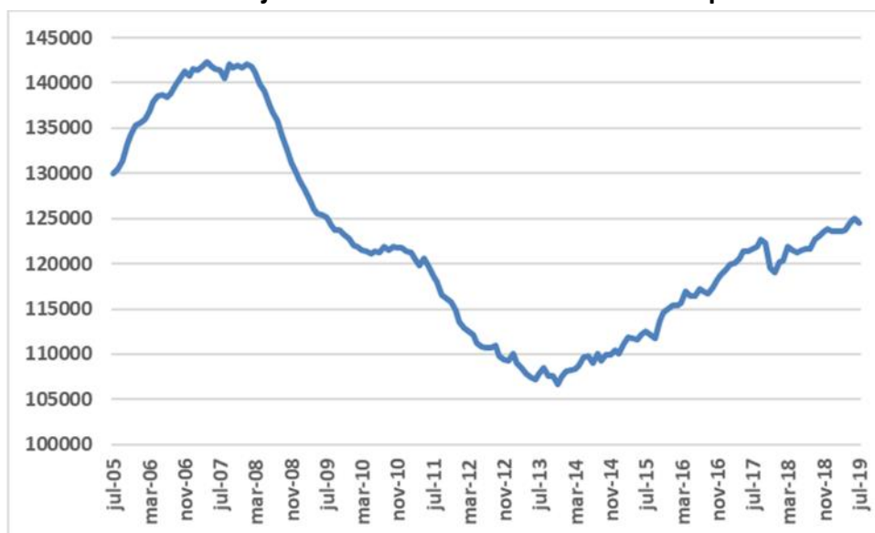
Gráfico 2. Número de trabajadores afiliados tras eliminar el componente estacional