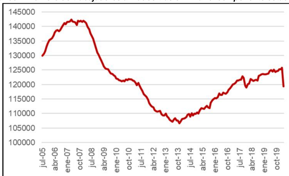
Gráfico 2. Número de trabajadores afiliados tras eliminar el componente estacional