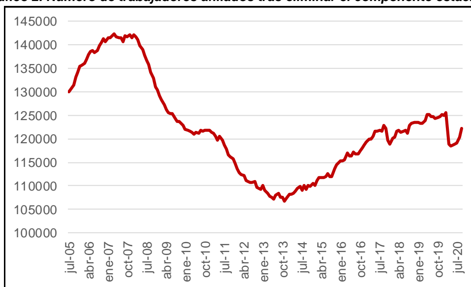
Gráfico 2. Número de trabajadores afiliados tras eliminar el componente estacional