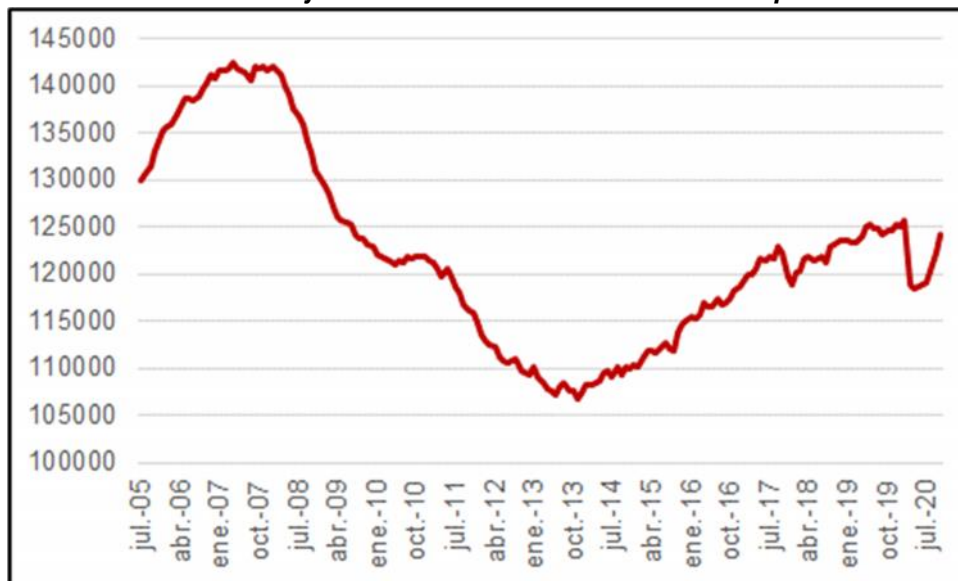
Gráfico 2. Número de trabajadores afiliados tras eliminar el componente estacional