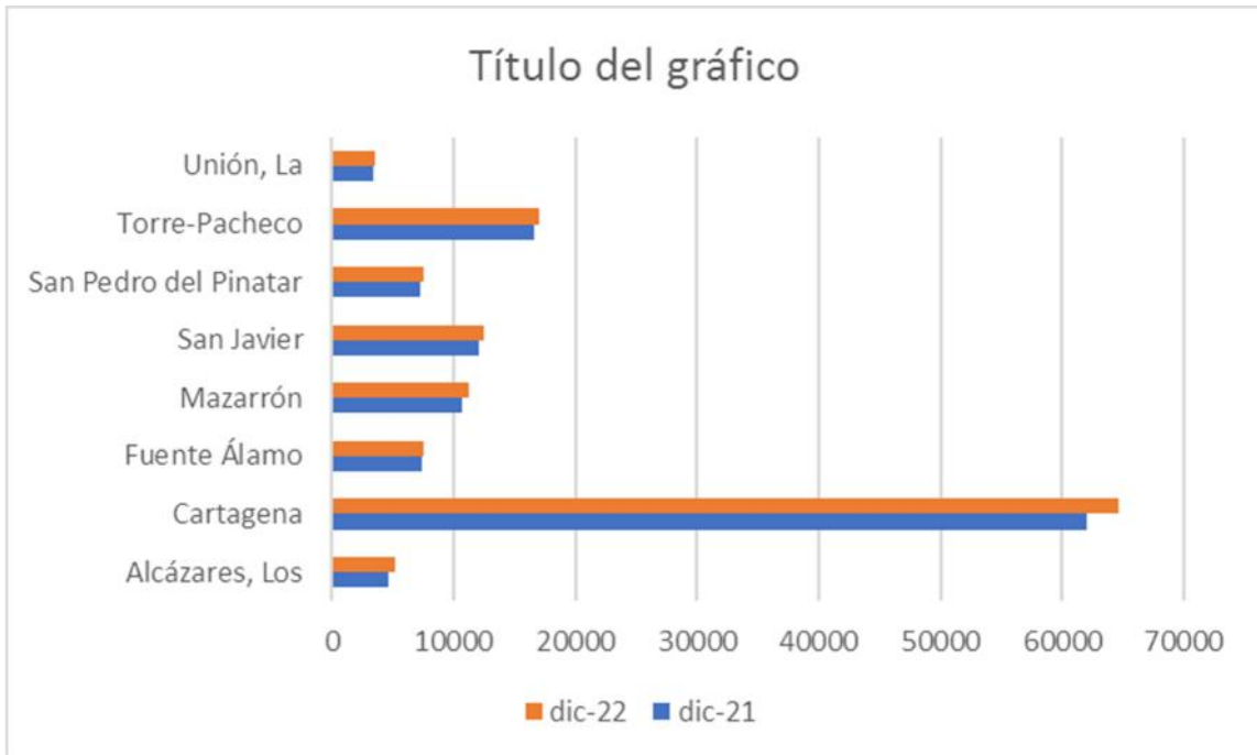
Gráfico 2. Variación interanual en el número de afiliados totales en la Comarca entre diciembre 2021 a diciembre 2022.

Nota 5: Elaboración propia con los datos del Ministerio de Inclusión, Seguridad Social y Migraciones.